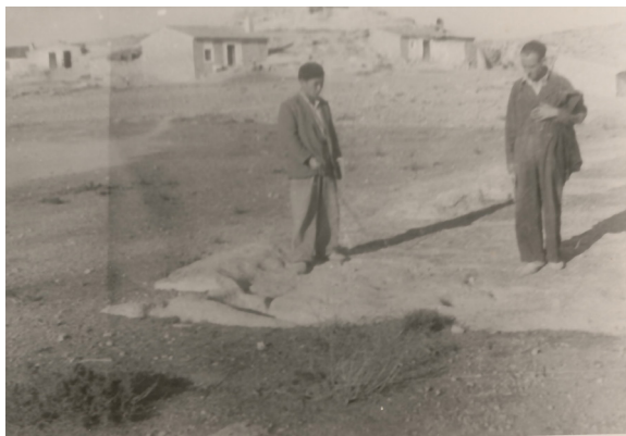
Visitantes sobre la excavación realizada por García y Bellido en 1942 de la necrópolis del Bancal del Estanco Viejo.

Fue descubierta por Federico de Motos en la primavera de 1915, procediendo entonces a su excavación, al tiempo que H. Breuil realizaba el calco del Abrigo Grande de Minateda (Ripoll, 1988). De aquella actuación, que sabemos que se desarrolló en menos de un mes, no queda ni diario ni ningún otro tipo de documentación. En 1928, catorce años después de la intervención, F. de Motos vende los materiales allí exhumados al Museo de Albacete, adjuntando algunos datos sobre los enterramientos, como una relación de los ajuares y, en algún caso, el tipo de fosa u hoyo donde se realizó la deposición.