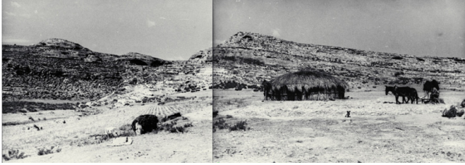
Trillando en la Era a los pies de Cabeza Llana

Su compromiso político lo llevó a ser elegido Diputado en las Cortes por su Castellón natal desde 1931 a 1933, militando en las filas de Acción Republicana, así como en diferentes logias masónicas. Todo ello le acarrearía tras la guerra una condena en rebeldía a veinte años y un día por el Juzgado Especial nº 3 del Tribunal Especial de Represión de la Masonería y el Comunismo. El inevitable camino del exilio lo llevó a Colombia en donde su figura siguió creciendo. Colaboró en la fundación del Museo Geológico del país, que acabaría llevando su nombre y en 1951, debido a la precaria salud de su mujer, se trasladó a Caracas donde fue Profesor Titular de la Escuela de Geología, Minas y Metalurgia de la Universidad