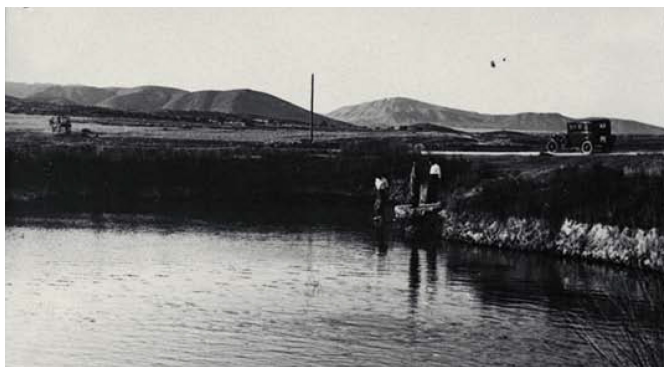
La Fuente de Isso. FDJRG. Museo Nacional de Ciencias Naturales(MNCN)-CSIC

Partieron desde Madrid hacia un viaje de ocho días en coche que les llevó a recorrer diferentes localidades de las provincias de Albacete, Murcia y Alicante, con objeto de prospectar muestras para las colecciones del Museo. La primera parada del periplo sería Hellín, a cuyo hotel Comercial llegaron el día seis de julio. Dedicaron esa tarde a visitar los alrededores de Isso, llegando hasta el pantano de Talave, como quedó reflejado en las numerosas fotografías que D. José fue tomando de los lugares visitados durante la expedición y que se conservan en un fondo especial del MNCN-CSIC.