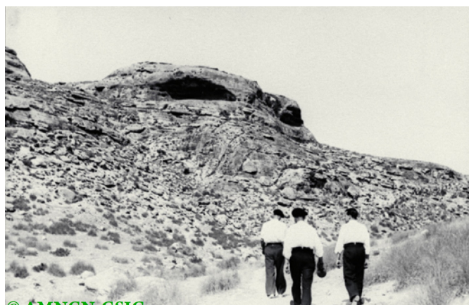
Hacia el Abrigo Grande.

Al día siguiente, sábado, los expedicionarios partieron hacia Minateda, Las Minas y Jumilla, sin que faltara la obligada visita a los abrigos de pinturas rupestres, desde los cuales también recogió numerosos testimonios fotográficos, con tomas de las sierras y el valle de Minateda y de los abrigos de pinturas. Esa noche volvieron a Hellín desde donde partirían hacia Cieza al día siguiente.