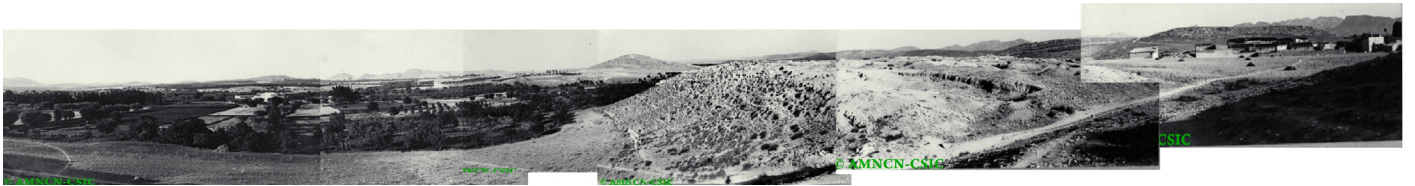
Montaje Prado de Isso, Cerro del Botero y Asomadilla. FDJRG. MNCN-CSIC

Todavía hoy, por las faldas de la Asomadilla, debe yacer el esqueleto fosilizado de algún mamífero algo mayor que un caballo, del cual otra expedición consiguió rescatar por esas fechas una deteriorada tibia que no permitió identificar el ejemplar.