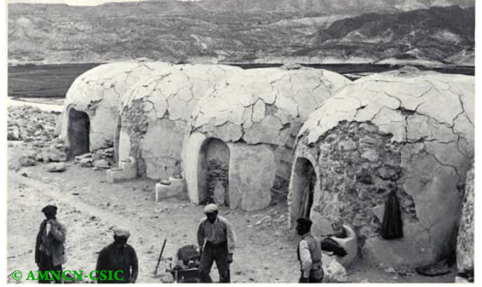
Hornos de azufre en Las Minas. 1937 FDJRG. MNCN-CSIC

Su compromiso político lo llevó a ser elegido Diputado en las Cortes por su Castellón natal desde 1931 a 1933, militando en las filas de Acción Republicana, así como en diferentes logias masónicas. Todo ello le acarrearía tras la guerra una condena en rebeldía a veinte años y un día por el Juzgado Especial nº 3 del Tribunal Especial de Represión de la Masonería y el Comunismo. El inevitable camino del exilio lo llevó a Colombia en donde su figura siguió creciendo. Colaboró en la fundación del Museo Geológico del país, que acabaría llevando su nombre y en 1951, debido a la precaria salud de su mujer, se trasladó a Caracas donde fue Profesor Titular de la Escuela de Geología, Minas y Metalurgia de la Universidad