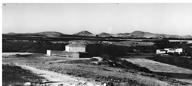
Hellín desde La Asomadilla.

Isso, la Asomadilla y el cerro del Botero (todavía sin depósito de agua), la Fuente, entonces rebosante de agua, así como las primeras casas de la población, algunas de las cuales son aún reconocibles. La Asomadilla debió despertar un gran interés en los investigadores, pues allí se localiza un yacimiento de moluscos y mamíferos del periodo Mioceno, materia en la cual José Royo era un gran especialista tras publicar en 1922 su tesis doctoral: El Mioceno continental ibérico y su fauna malacológica.