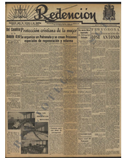
Publicación Redención. Biblioteca Instituciones Penitenciarias