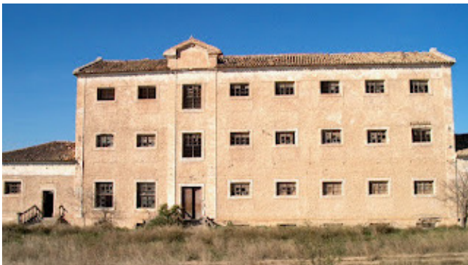
Foto Prisión central de La Loma antes de ser derruida